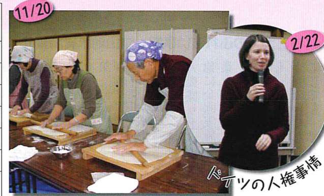
男女共同参画~そば打ち~