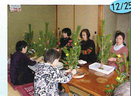
お正月の生け花教室