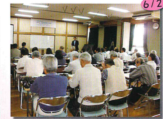
人権学習講演会②身近な相続の問題

男女差別・外国人差別など様々な人権について 認識をさらに深めることができました。