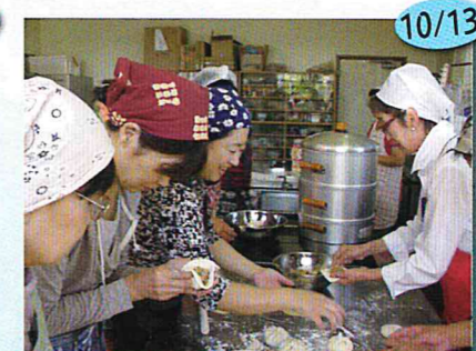
国際交流~ふわふわ肉まん~