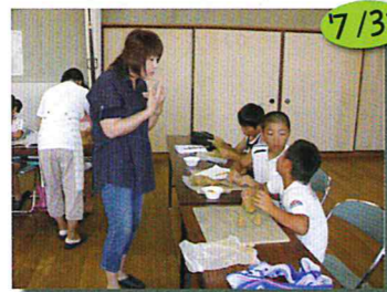
夏休みテラコッタ教室