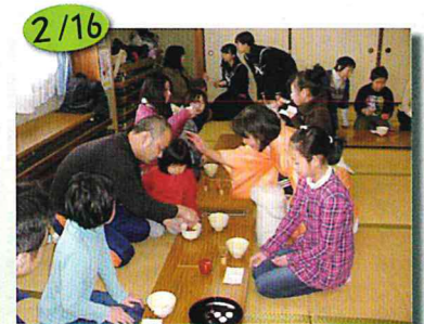
お茶会をひらこう