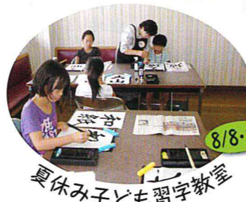
夏休み子ども習字教室