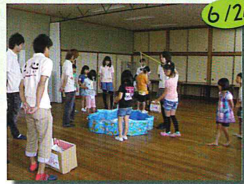
【ワクワク①】エコキッズ