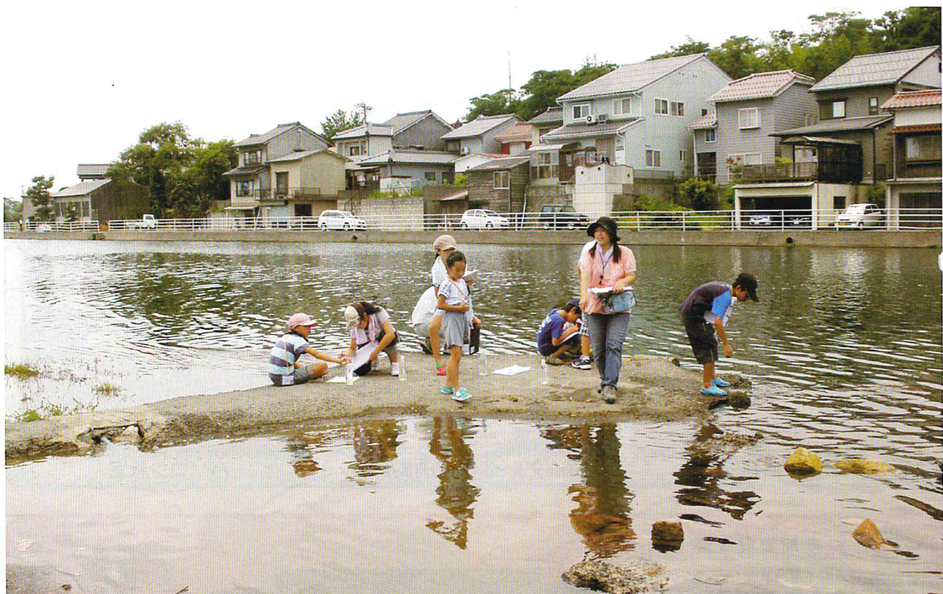
子どもと大人のふれあい事業 湖山池水質調査Ⅱ 7月29日(源流～河口)

平成二十四年度も地区の皆様のご協力、ご支援を頂き、無事に各事業を終えることができました。私も、館長の拜命を頂いて一年が経ちました。事業を振り返ってみますと、「子どもと大人のふれあい事業」では、他の事業も好評でしたが、毎年、子どもが楽しみにしている、夏場の「めん流しを楽しもう!」は、大好評でありました。「特色ある公民館活動事業」においては、盛夏の中での湖山公園クリン作戦には、子どもと保護者や湖東中学校の女子テニス部の皆様のご協力を頂きました。また、自治会と共催の、第三回湖山地区文化祭の中の、「心ふれあいコンサート」には、多くの教室の皆様や、サークルの皆様にご参加して頂き大変盛り上がりしました。他に企画実施しました事業も、何れも好評でありました。「人権啓発推進事業」も、計画通りに進めることができました。次年度におきましても、湖山地区人権啓発推進協議会と連携し、小地域懇談会等の実施に力を入れていきたいと思っております。「協働のまちづくり」につきましては、湖山地区自治会が策定した、「地域コミュニティ計