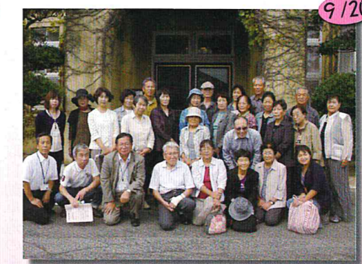
県外研修~岡山県長島愛生園~