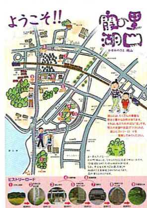
作製中のヒストリーロードマップ

それでは課題と展望について申し上げます。まず第一に長年の懸案であった湖山地区公民館移転新設についてであります。既に自治会等で報告させていただいておられますように、旧湖山町農協跡地に移転新設をする計画で鳥取市と基本合意して、平成