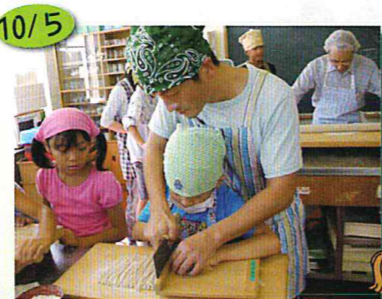
親子の料理教室Ⅱ そば打ち体験